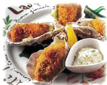
お洒落な一品にも!