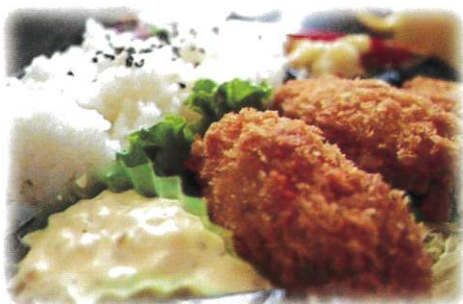
お弁当のおかずにも!