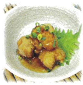
あんかけ風に・・・